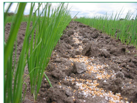
Tabla 1. Prácticas de fertilización

El Multicote Agri® que fue elegido para esta misión tenía una longevidad de cuatro meses, con una tasa N:P 2 O 5 :K 2 O de 13,5-4,5-36,5. Dado que el producto está basado en una mezcla de parte recubierta y parte no recubierta, el seleccionado para esa oportunidad tuvo la siguiente composición: 70% de N recubierto, 0% del P recubierto y 70% del K recubierto. Mientras que la parte no recubierta proporciona la liberación inicial, la parte recubierta aporta una liberación de nutrientes de tipo prolongado en el tiempo. El fertilizante Multicote Agri® fue aplicado únicamente como fertilización de base, a una tasa de tan sólo el 60% del NPK convencional recomendado.